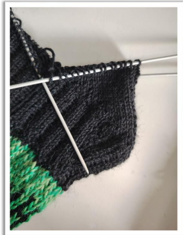
Muodostuva kantapään kavennustinja